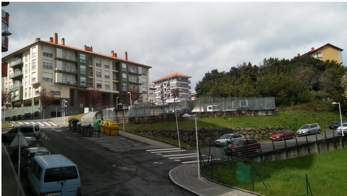
Vista 2. Vista general de la parcela desde C/Letraukua