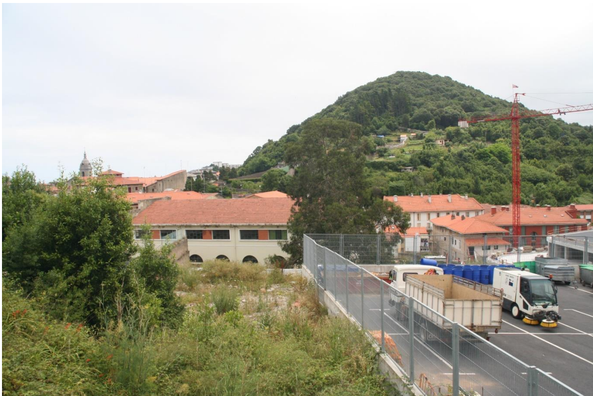
Vista 4. Zona Norte de la Parcela. Vegetación de escaso interés con presencia de escombros