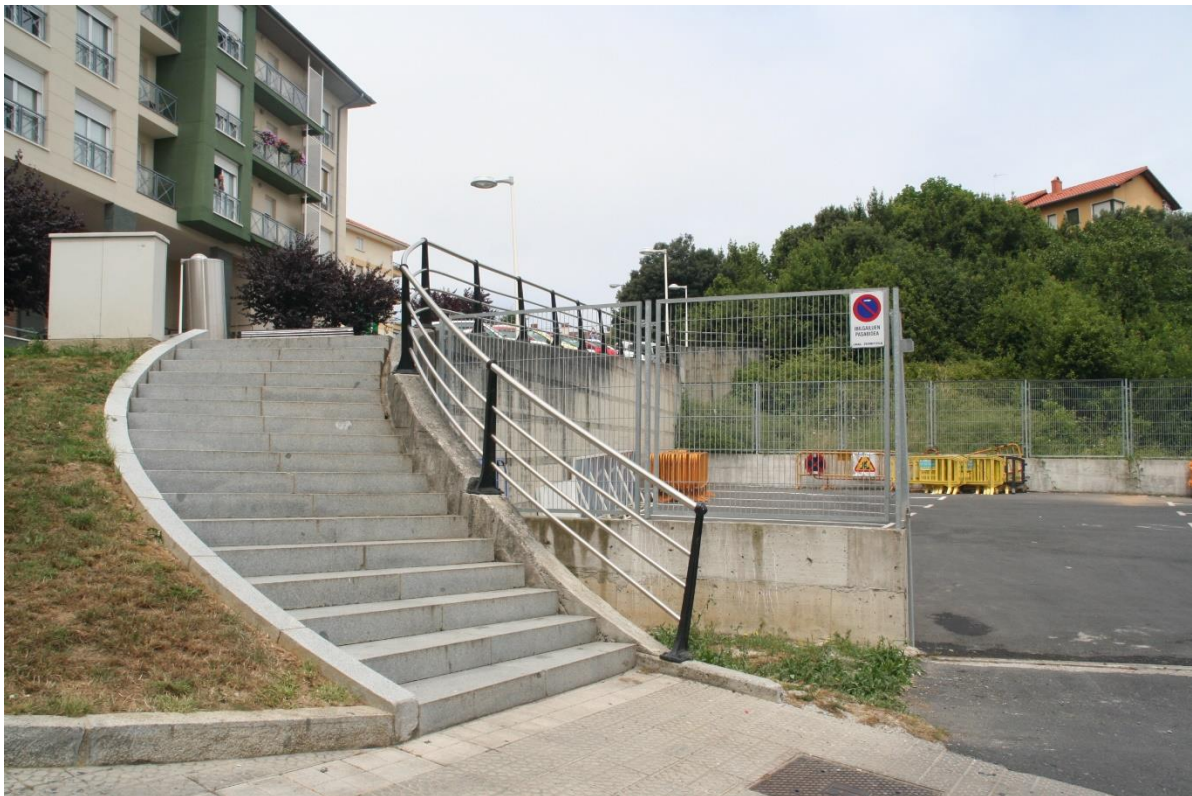
Vista 3. Vista desde el acceso al Parking existente en la actualidad